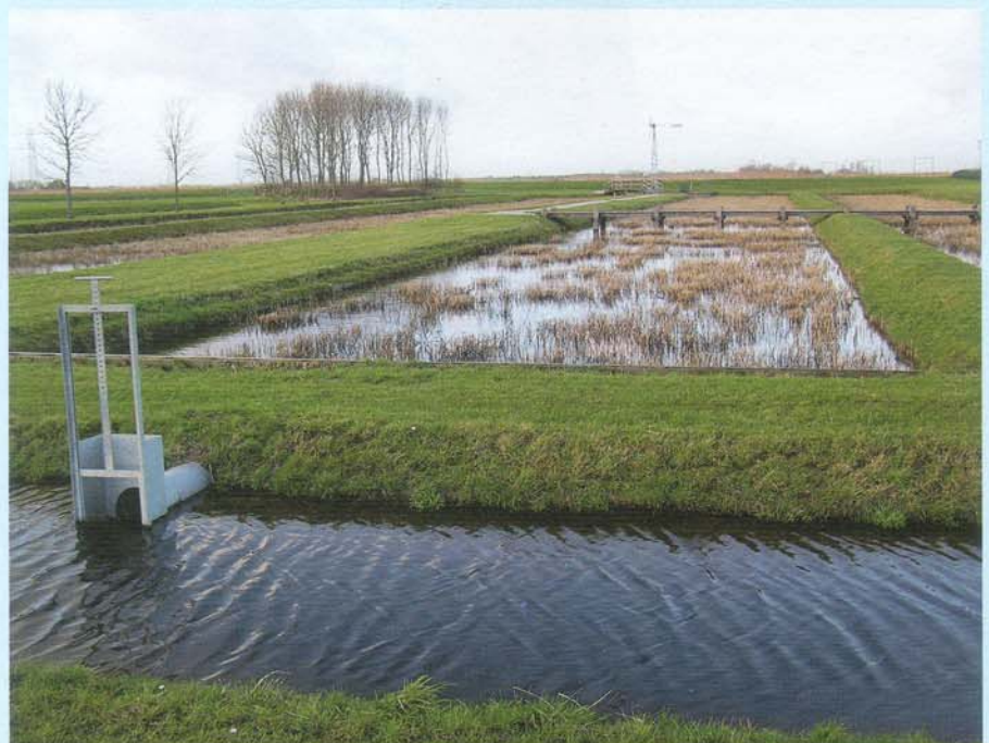
Aqualan, rwzi Grou.

twee STOWA-rapporten: één gebaseerd en gericht op de Nederlandse situatie 7) en één op ontwikkelingslanden 8) . Alle kennis en ervaring tot dan toe zijn hierin beschreven. In deze periode is de Waterharmonica een haast wereldwijd begrip geworden, niet in de laatste plaats door diverse lezingen, publicaties en cursussen en de speciale sessie over de Waterharmonica tijdens de in 2004 gehouden Internationale wetlandconferentie in Utrecht 9) . Dit alles heeft ook geleid tot een intensieve samenwerking met het Consorci de la Costa Brava (Spanje), toen bleek dat het wetland van de rwzi Empuriabrava een parallelle ontwikkeling bleek te zijn. In deze Waterharmonica wordt het effluent op praktijkschaal geschikt gemaakt voor gebruik in het nationaal park Aiguamolls de l'Emporda.